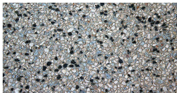
Detalhe do Sistema DECO SELECT +